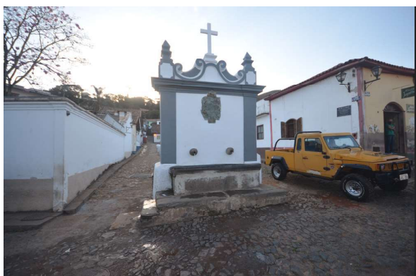
Vista do Chafariz do Caquende em que se pode ver o calçamento atualmente existente na rua em frente. Data: 27/07/2021.