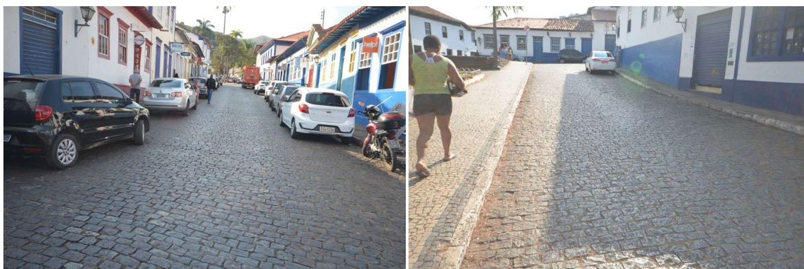
Calçamento atualmente existentes de paralelepípedo na rua Dom Pedro II e Praça Santa Rita. Data: 27/07/2021.