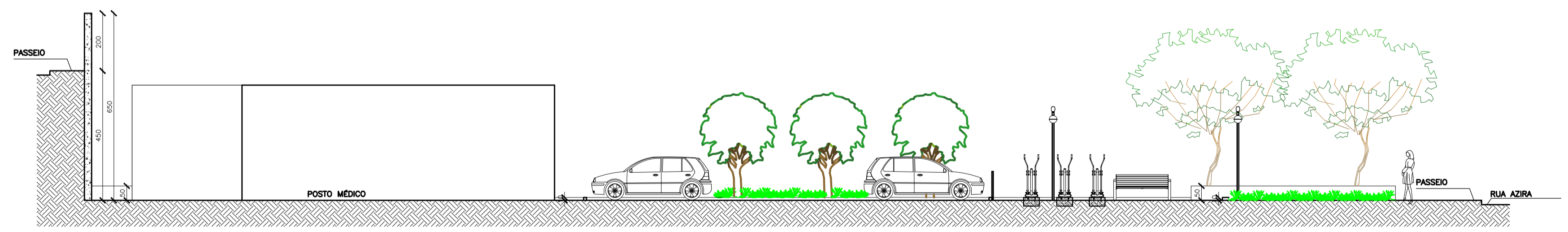
CORTE AA ESCALA 1/100