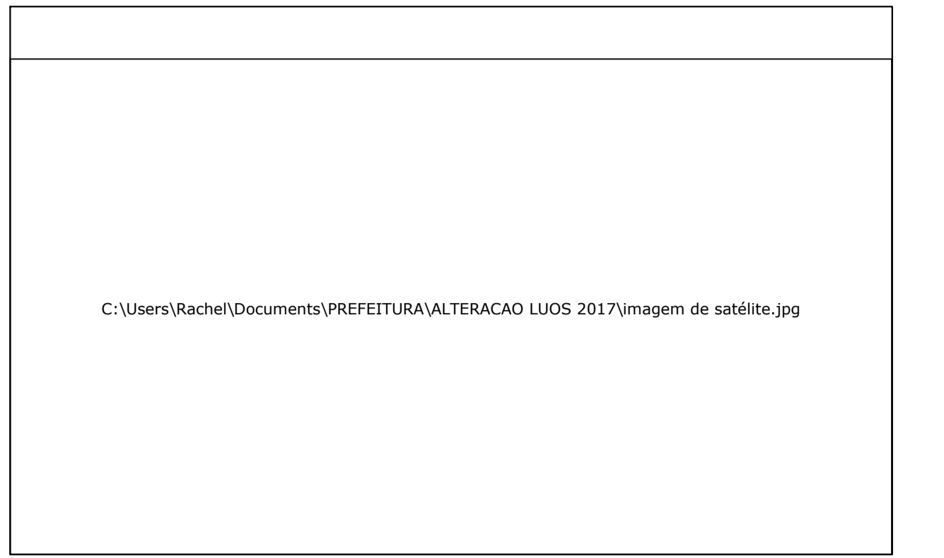
IMAGEM DE SATÉLITE SEM ESCALA