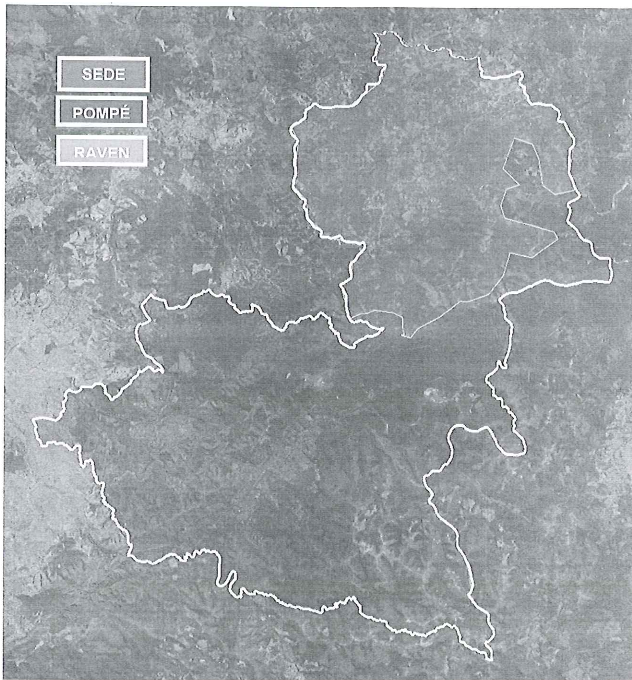
Imagem de satélite com a delimitação das zonas de expansão urbana