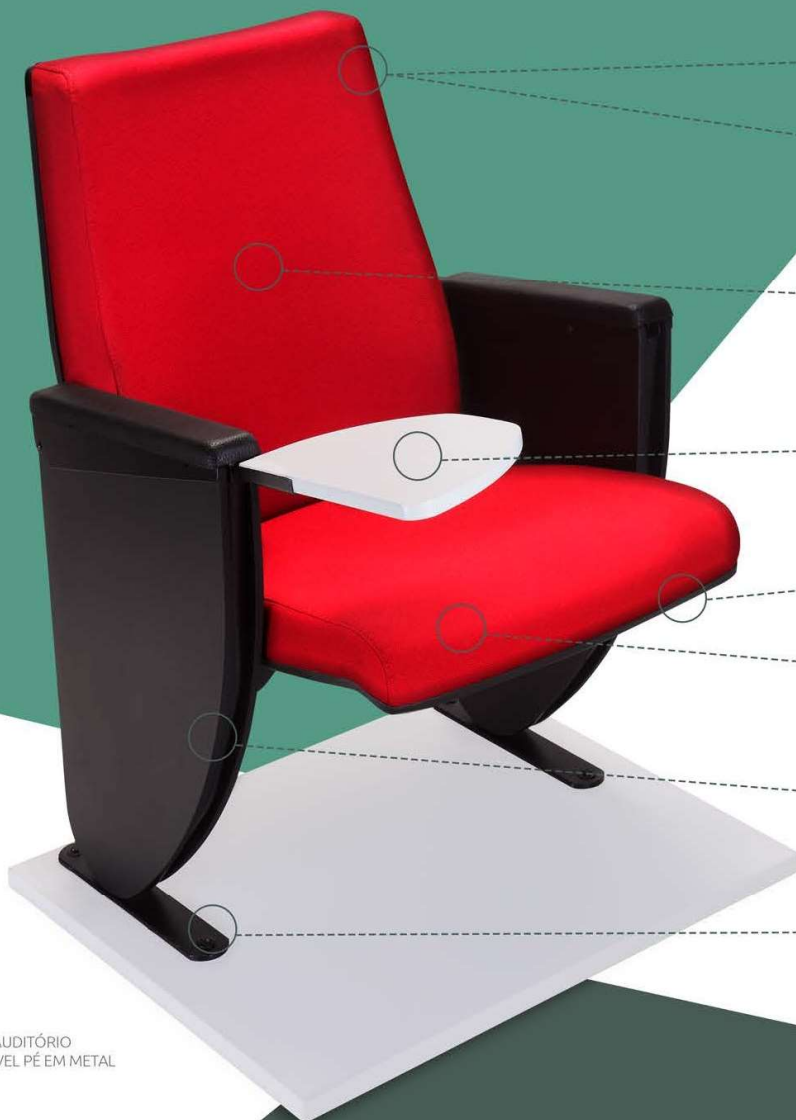
AU.36.37 POLTRONA DE AUDITÓRIO SONATA REBATÍVEL PÉ EM METAL