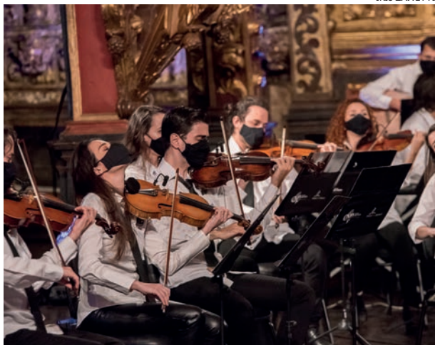
Orquestra Ouro Preto em Sabará