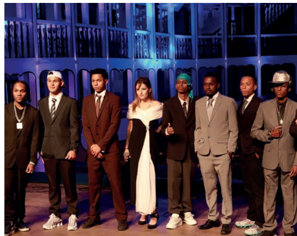
Música e Vídeo