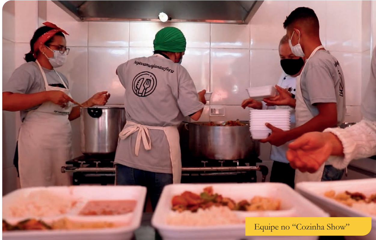
Equipe no "Cozinha Show"

A 23ª edição do tradicional Festival do Ora-Pro-Nóbis, organizada pela Prefeitura de Sabará, foi realizada entre os dias 22 e 25 de junho com uma nova roupagem. Em 2021, ela lançou a Mostra Gastronômica Virtual de Pratos, que teve como ingrediente principal o ora-pro-nóbis.