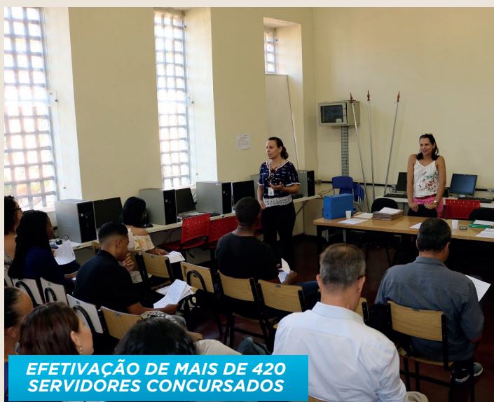
EFETIVAÇÃO DE MAIS DE 420 SERVIDORES CONCURSADOS