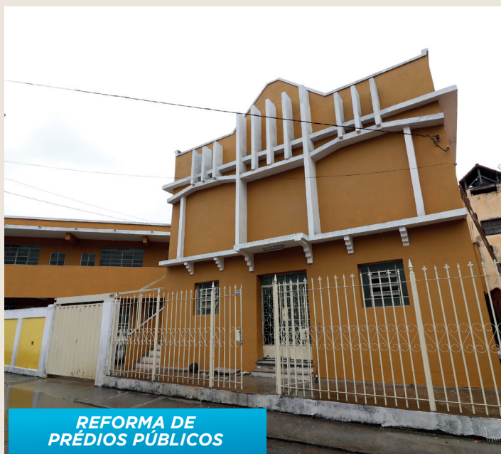
REFORMA DE PRÉDIOS PÚBLICOS

2020 nos surpreendeu com fortes chuvas e agora com a Pandemia do Coronavírus. Mas fique tranquilo, a Prefeitura de Sabará continua, 24 horas por dia, trabalhando por você.