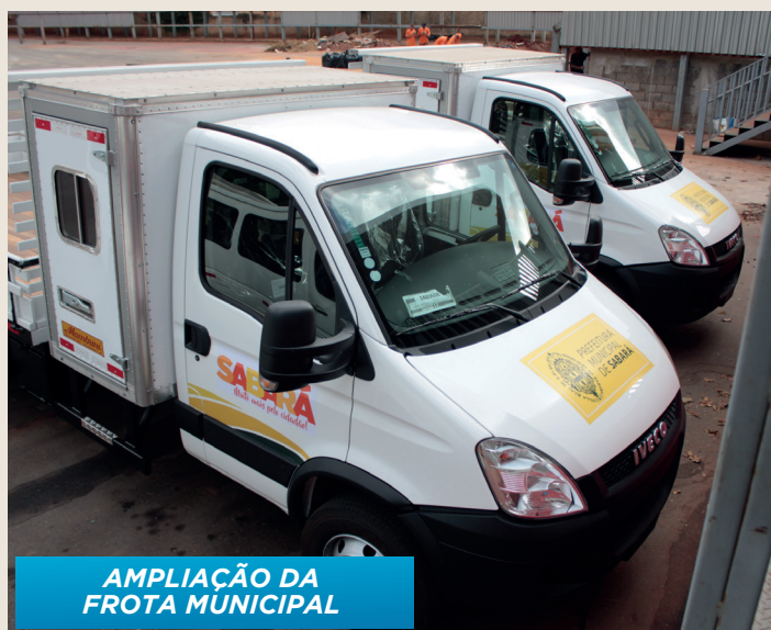
AMPLIAÇÃO DA FROTA MUNICIPAL

DIANTE DOS DESAFIOS, UMA GESTÃO COMPROMETIDA FAZ A DIFERENÇA! E PARA MOSTRAR QUE TRABALHAMOS POR VOCÊ, PRESTAMOS CONTA DO NOSSO TRABALHO!