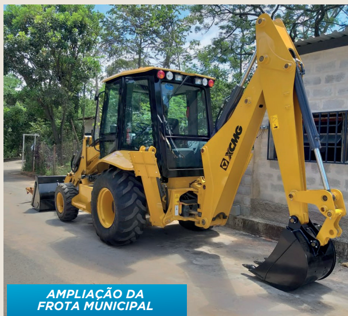
AMPLIAÇÃO DA FROTA MUNICIPAL