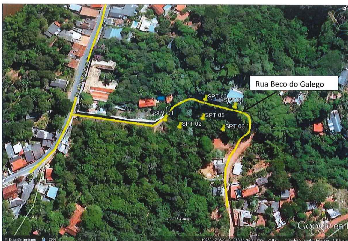
Figura 01 – Localização da Rua Beco do Galego

Aencosta, objeto de estudo deste relatório, encontra-se na rua Beco do Galego, no bairro Galego – Sabará/MG (Figura 01). Coordenadas - Latitude: 19°53'51,16"S e Longitude: 43°48'43,18"O.